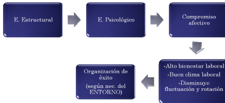
Figura 2 Modelo de Jáimez y Bretones (3)

El fin sería desarrollar una cultura de empoderamiento con el objetivo de que no solo aumenten su productividad, sino que puedan ser consideradas organizaciones saludables y que garanticen el bienestar de los trabajadores. De aquí en adelante definiremos la cultura de empoderamiento como un proceso multidimensional, donde el entorno y la organización propician una cultura conformada desde los valores, identidad y significados compartidos, de desempeño exitoso.