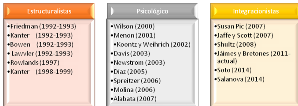
Figura 1 División epistemológica de autores que definen el constructo empoderamiento

La primera de esas perspectivas, denominada empoderamiento estructural, considera conveniente utilizar un set de actividades y prácticas llevadas a cabo por la dirección para dar poder, control y autoridad a sus subordinados. Esta visión significa que la organización tiene la garantía de que los empleados reciben información sobre los resultados de la organización. Que los mismos poseen los conocimientos y destrezas para contribuir a la consecución de las metas, que cuentan con poder para tomar decisiones fundamentales y son recompensados en base a los resultados obtenidos. (11)